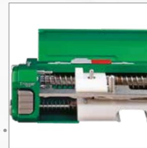
Federsystem des Magnum® Biopsiesystems im Geräteinneren